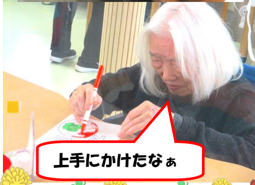
上手にかけたなあ

ダンスダンスでは、他にも利用者様に洗濯物を干したりたたんで頂いたり、米研ぎや食器洗い、裁縫、手作業など、得意なことや興味のあることなど、いろいろな活動に取り組んでいただくようにしています。職員も利用者様に寄り添いながら一緒にさせて頂いています。